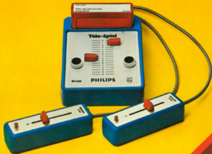
Abbildung Grundausstattung – beinhaltet Steuergerät mit Spielkassette „Federball“ und zwei Handregler.

Tele-Spiel und Tele-Spielkassetten gibt es nur in Spielwaren-Fachgeschäften und -Fachabteilungen. console-picture-page.de